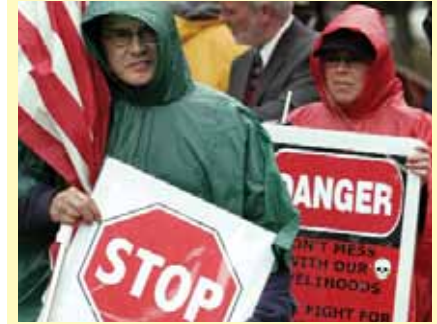
Рабочие протестуют против Delphi

США 31 марта компания Delphi подала в Федеральный Суд по делам о несостоятельности ходатайство с просьбой позволить ей разорвать имеющиеся коллективные соглашения, добиваясь тем самым возможности значительно урезать размеры зарплат, сократить десятки тысяч рабочих мест и закрыть более двух десятков предприятий в США.