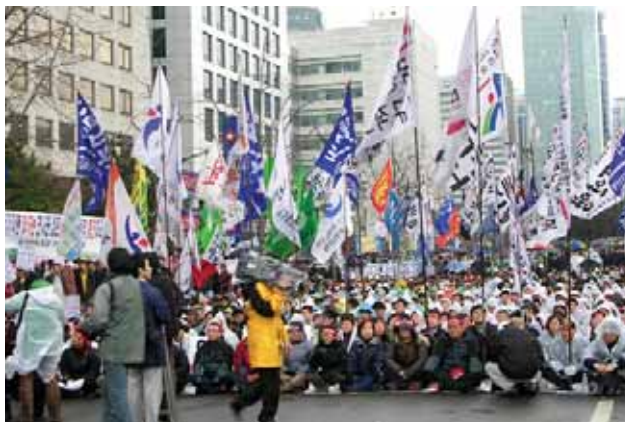
Рабочие протестуют против закона о временных рабочих, Сеул, Республика Корея, февраль 2006 года

Сопrotивление трудящихся навязываемой им нестабильности растет. Во Франции совместными усилиями рабочие и студенты отразили покушение правительства на основные трудовые гарантии. В Корее профсоюзы и демократическая рабочая партия борются за основные права и гарантии для всех работников, в том числе и непостоянных. В Индонезии профсоюзы вышли на улицы, протестуя против неприемлемых изменений в трудовом законодательстве, а в Индии — тысячи контрактных рабочих участвовали в забастовке на заводе Honda Hero, требуя постоянной занятости. Трехсторонние национальные переговоры в Испании привели к установлению всех социальных и трудовых гарантий для временных контрактных рабо-