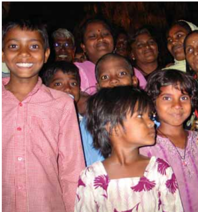
Дети многих рабочих, занятых утилизацией судов, посещают школу, расположенную вблизи офиса MPTDGEU

Таким образом, мы получили уверенность в профсоюзе, в том, что профсоюз делает что-то для нас», — говорит он. —