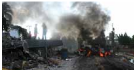
Штурм сталелитейного завода полицией

"Тот факт, что мексиканское правительство и компании, с которыми оно сотрудничает, готовы скорее вести переговоры с помощью пуля, чем разумных доводов, еще раз подтверждает, насколько важна та борьба, которую ведут наши мексиканские братья и сестры. МФМ и наши членские организации продолжат кампанию за прекращение насилия в отношении Наполеона Гомеса и членов SNTMMS." КП