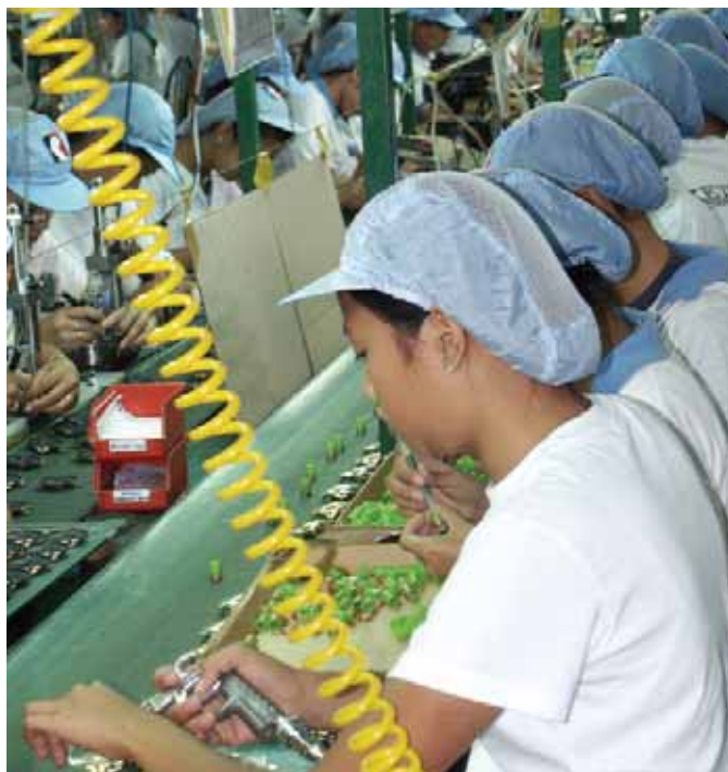
Женщины на производстве электронных деталей

Расширение практики непостоянного контрактного найма — это общемировое явление. Так, в автомобильной отрасли США, согласно исследованиям Urjohn Institute, временная занятость характерна скорее для иностранных компаний, предприятия которых, как правило, расположены в штатах, законодательство которых затрудняет формирование профсоюзов. Например, несколько лет назад Toyota приняла решение отказаться от непосредственного найма на своем сборочном заводе в Кентукки, где тогда не было профсоюза. В результате, единственный способ получить тут место — это обратиться в Manpower, крупнейшее мировое агентство временного найма. Рабочим обещают, что через год-другой они будут включены в платежные ведомости Toyota.