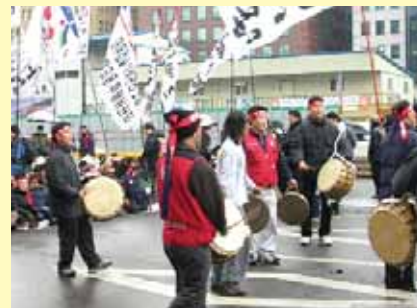
Протест против закона о нерегулярной рабочей силе

МФМ обратилась к президенту Южной Кореи Ро Му Хену с призывом немедленно освободить Джеона и призвала свои членские организации направить подобные письма протеста в адрес южно-корейского президента. АГ