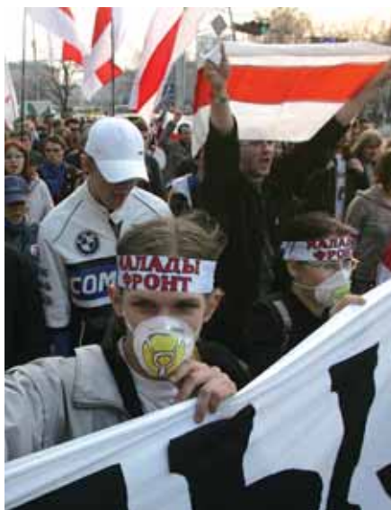
Шествие, посвященное 20-й годовщине Чернобыльской катастрофы