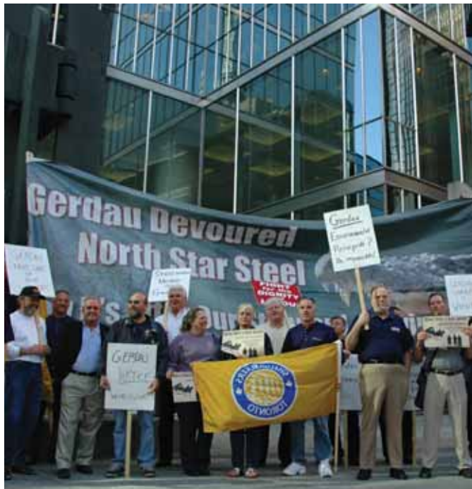
Демонстрация рабочих на собрании акционеров