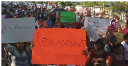
Протест против убийства двух мексиканских металлостов

НОРВЕГИЯ На своем заседании в Осло Исполнительный Комитет МФМ пообещал оказать поддержку Наполеону Гомесу Уррутиа и мексиканскому профсоюзу горняков в их борьбе против вмешательства властей во внутренние дела профсоюза. Гомес не смог лично присутствовать на заседании, однако направил в адрес членов Исполкома видеообращение с изложением последних событий, происходящих в Мексике.