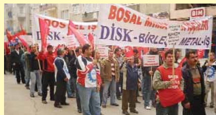
Первое мая 2006

Компания Bosal со штаб-квартирой в Бельгии - ведущий производитель выхлопных систем — имеет 32 производственных предприятия в 21 стране. Сейчас речь может вестись о возможном Международном Рамочном Соглашении с компанией Bosal.