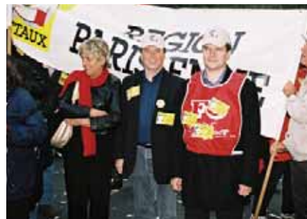
Митинг FO Metaux против закона о ДПН

улицы городов, протестуя против введения в действие закона о первом найме, принятого парламентом по инициативе премьер-министра в начале апреля. В университетах и вузах на несколько недель были прекращены занятия: студенты присоединились к рабочим, включившись в акции протеста по всей стране.