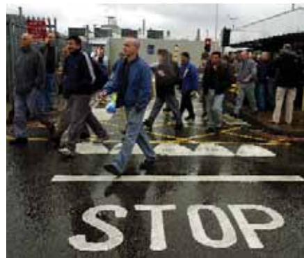
Рабочие покидают завод в Ритоне (Ковентри, Великобритания)

Согласно глобальному соглашению, "в случае изменений в деятельности компании PSA Peugeot Citroen согласна заблаговременно информировать соответствующие органы местной власти и сотрудничать с ними с тем, чтобы максимально учесть интересы местного населения". Соблюдение этих условий крайне важно для работников завода в Ритоне, работников предприятий-поставщиков в Ковентри и его окрестностях, а также для жителей местных сообществ. КП