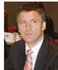
Йенс Стольтенберг